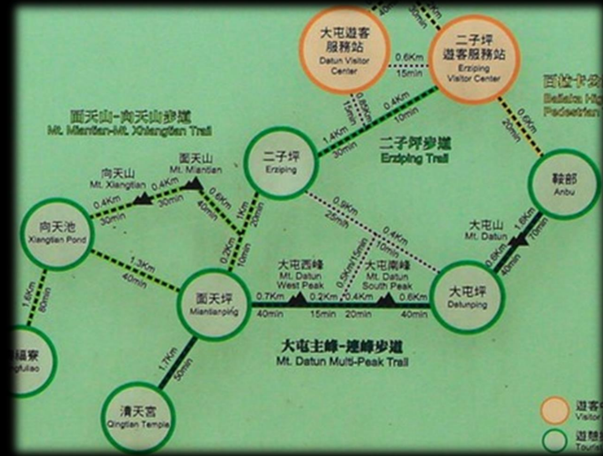
步道路程與高度落差圖