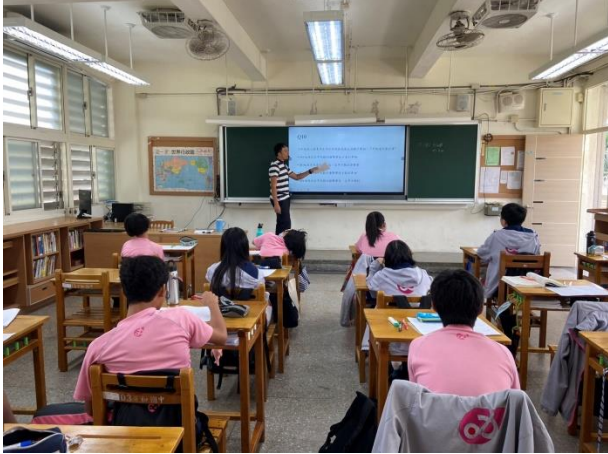
理化科融入光與聲音-老師講解