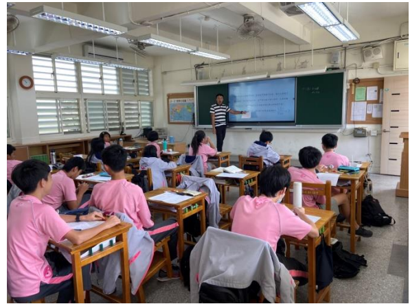
理化科融入光與聲音-老師講解