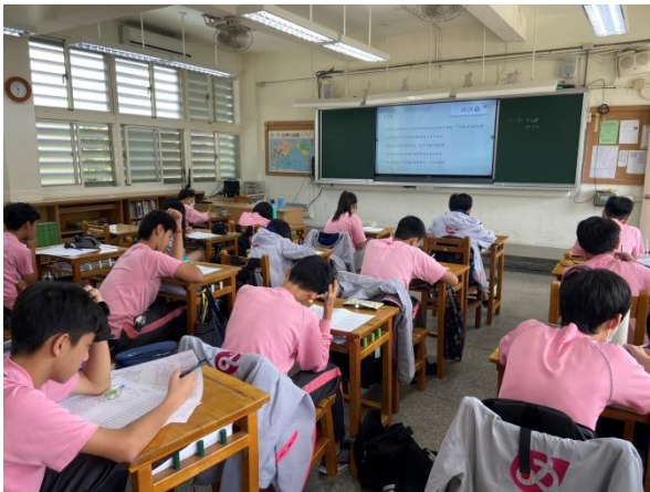
理化科融入光與聲音-學生練習