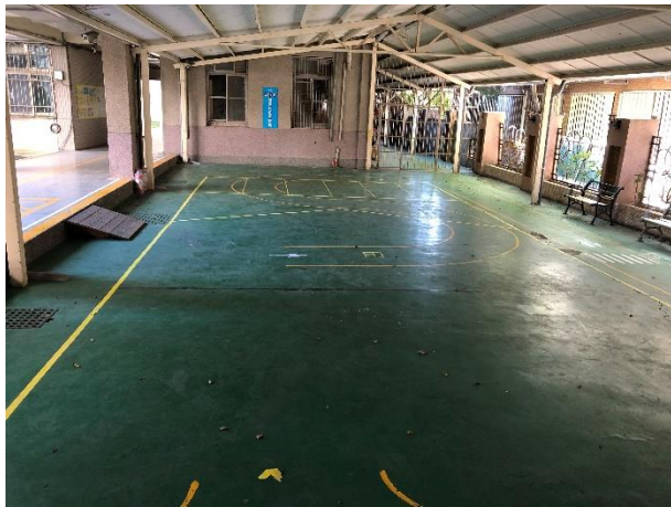
自行車騎乘技術考驗場