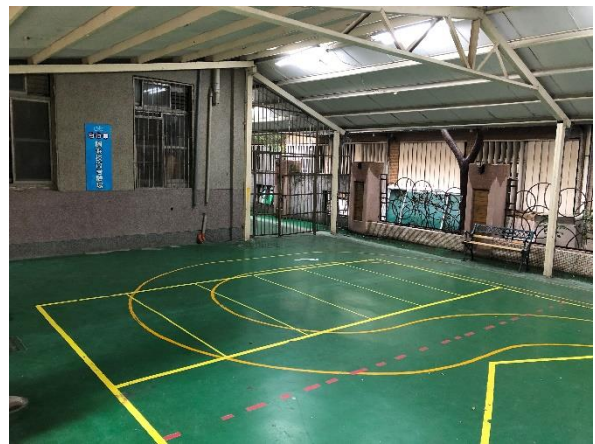
自行車騎乘技術考驗場