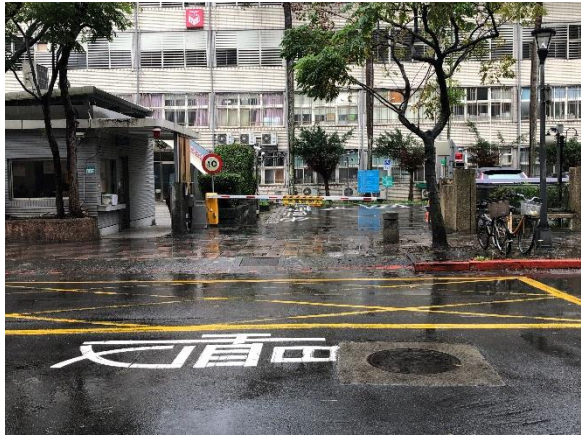
校門車道出入口網狀線