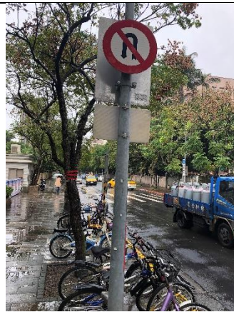
校門口北向禁止迴轉