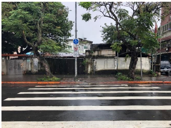
校門前枕木紋行人穿越道