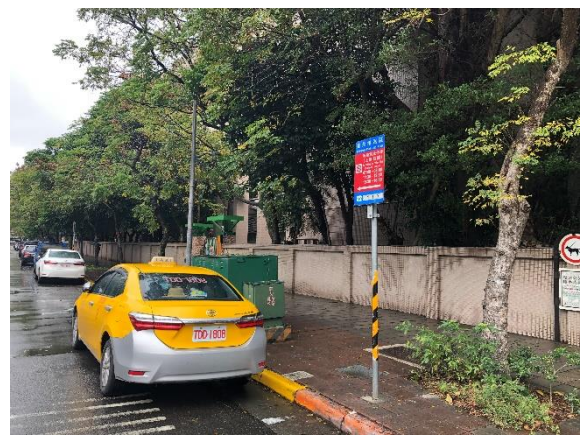
上、放學家長接送區