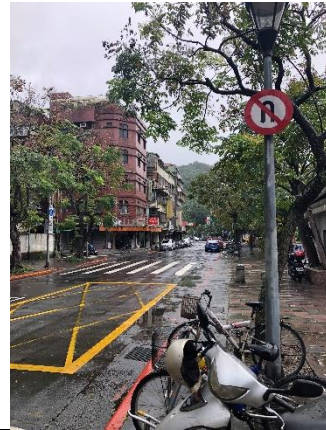
校門口南向禁止迴轉