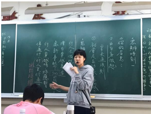
交通安全標語—反思討論