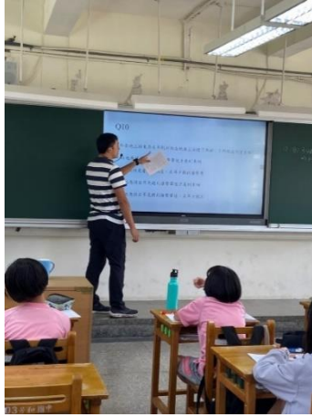
理化科融入光與聲音-老師檢討