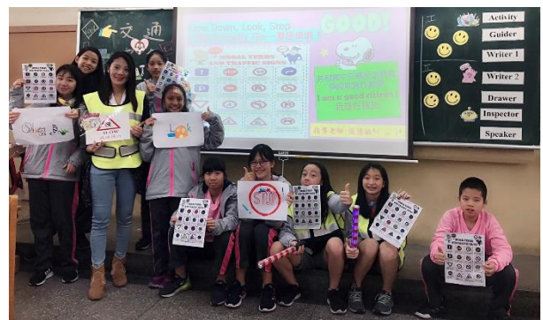
英文情境教學-學生作品展現