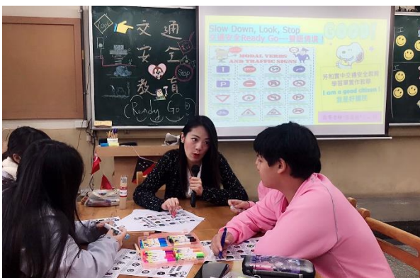
英文情境教學-老師帶領反思