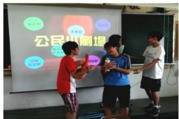
公民交通安全情境劇