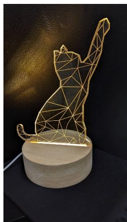
(雷射光雕小夜燈樣本)