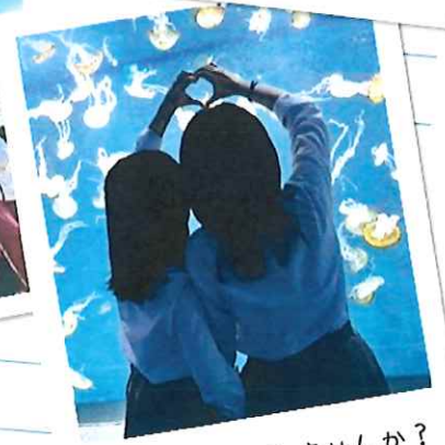
日本留学してみませんか?