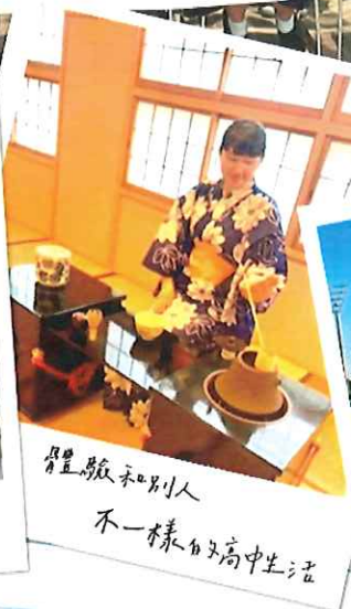
尊重自己和別人 不一樣的高中生活