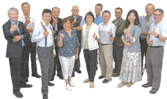
旺宏科學獎評審團陣容堅強