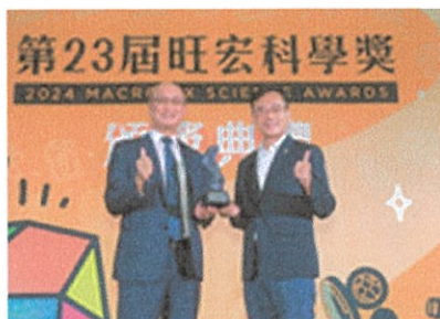
教育部次長林騰蛟多次出席活動給予指導與鼓勵