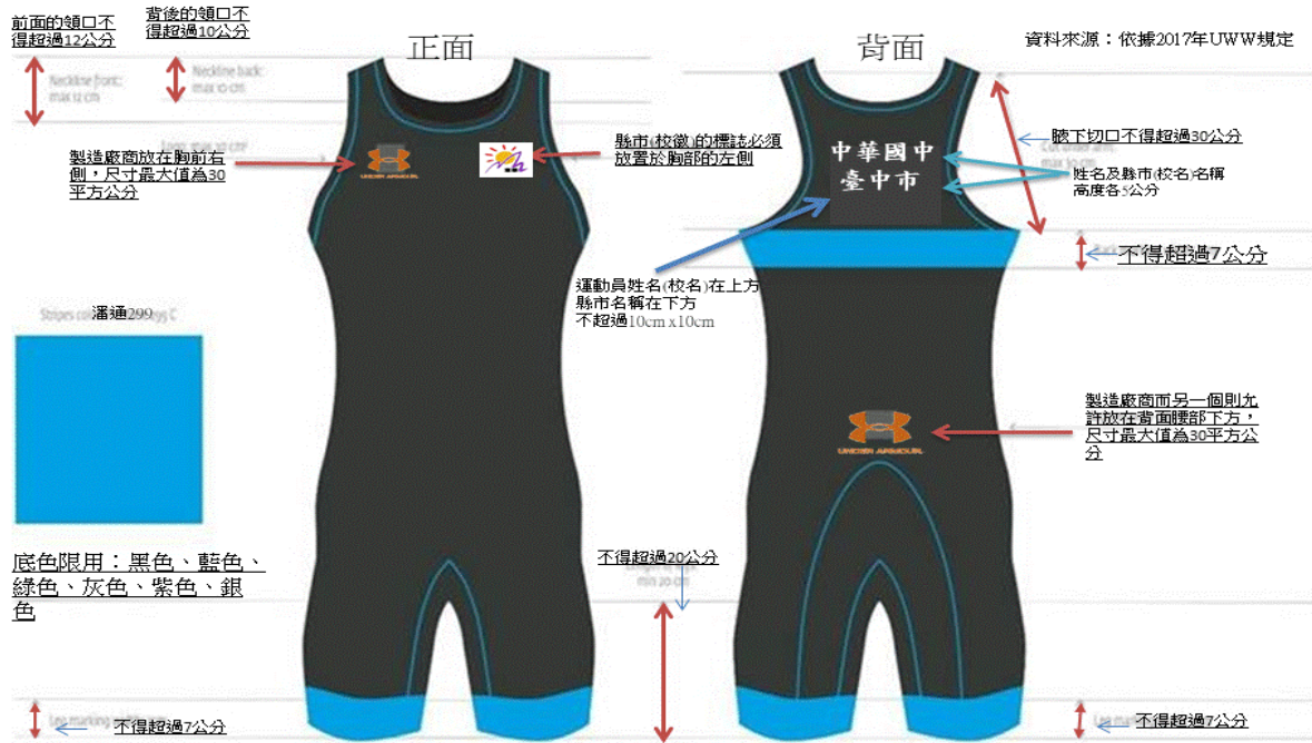
角力服腿的長度必須停止於膝蓋上方，並且不得短於膝上15公分