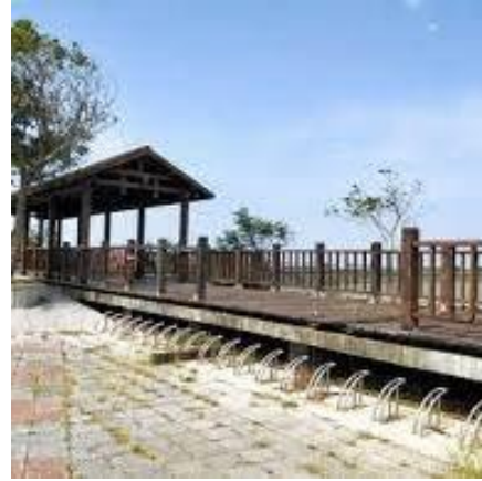
掌潭滯洪池景觀台