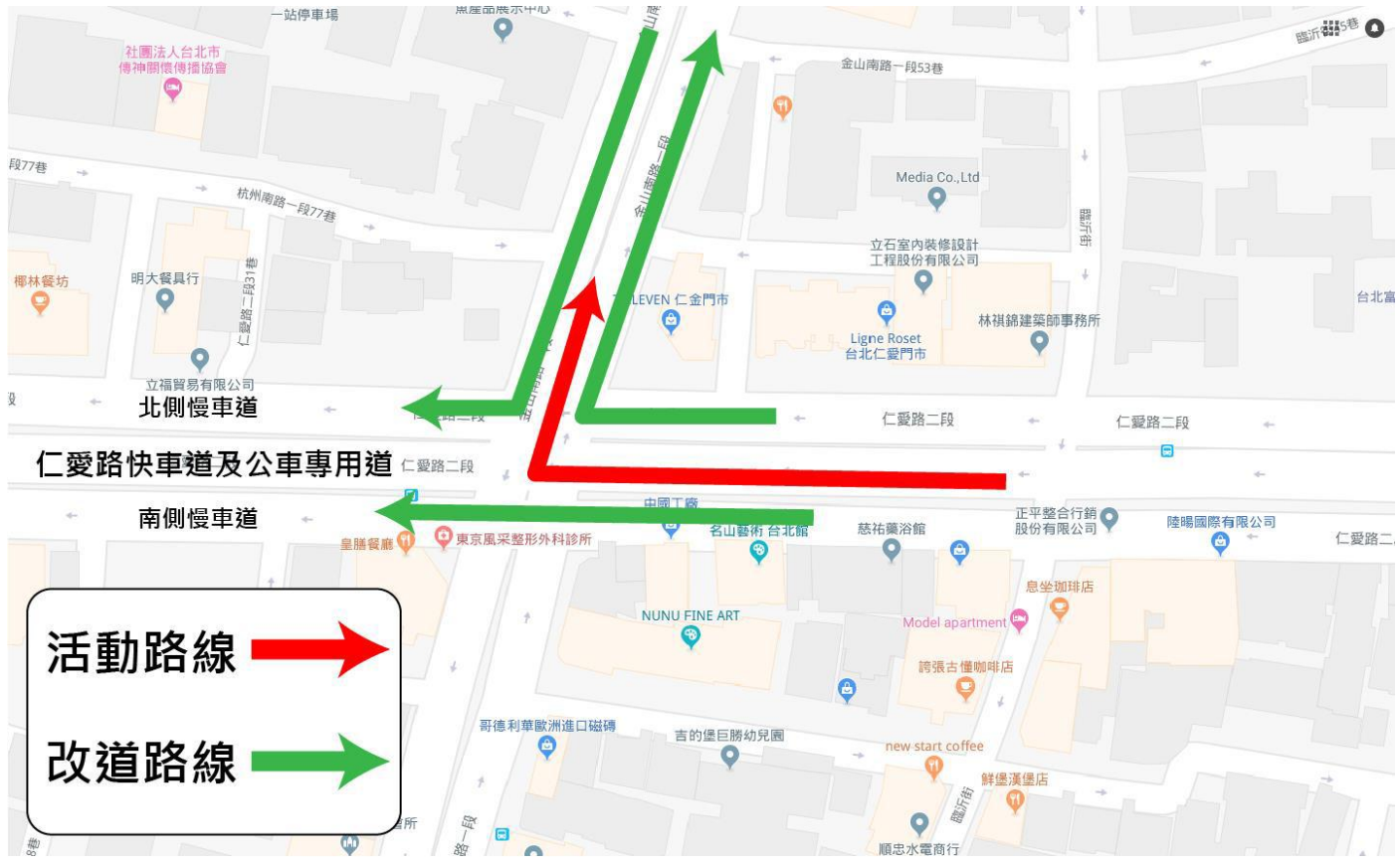
圖 1 仁愛路-金山南路改道圖

六、倘對於活動路線仍有疑義，請逕洽主辦單位執行單位：創意實踐家企業股份有限公司承辦人：顏先生，聯絡電話：0978-060609。